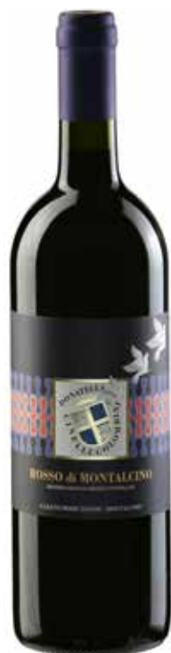
Rosso di Montalcino DOC 2012