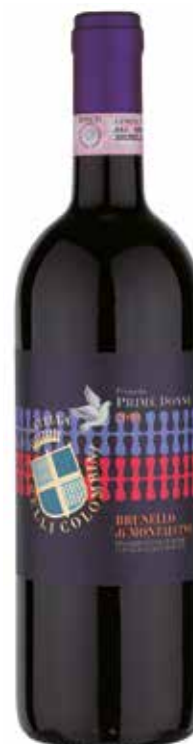
Brunello di Montalcino DOCG SELEZIONE PROGETTO PRIME DONNE 2010