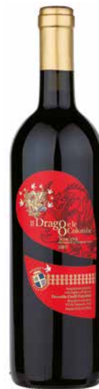
Il Drago e le 8 Colombe IGT 2010