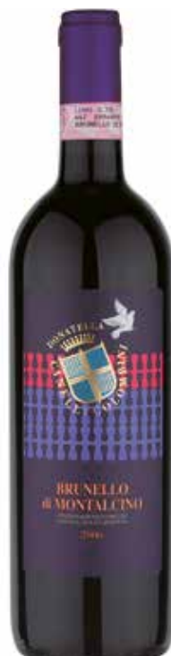
Brunello di Montalcino DOCG 2010