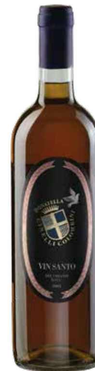
Vinsanto del Chianti DOC 2003